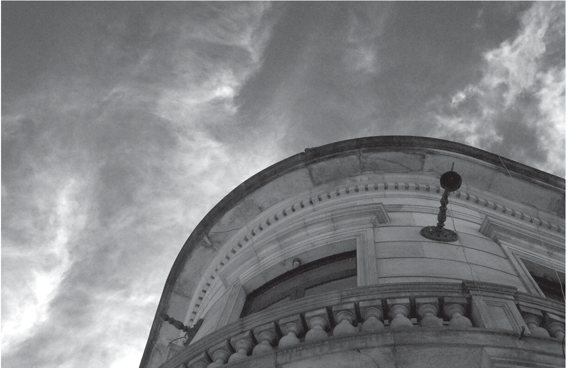
ARQUITECTURA, 2004