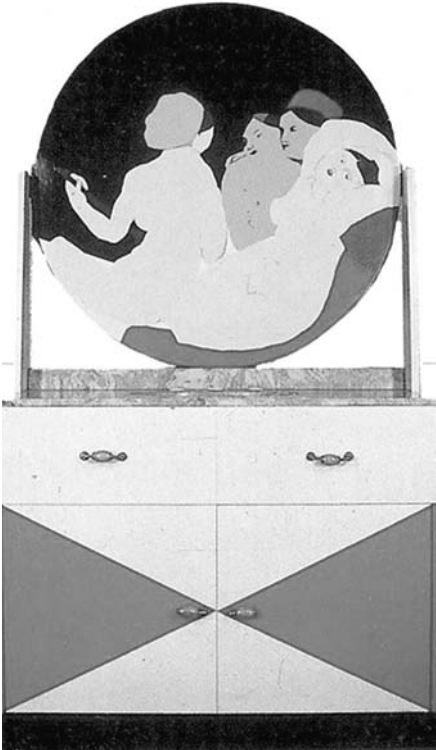
B. González. El baño turco o los artifices del mármol . Esmalte sobre metal montado en madera, fórmica y mármol artificial. 137 x 121 x 155 cm. 1974.

Traba desplaza así el kitsch de sus asociaciones tempranas con el arte hacia las apropiaciones subdesarrolladas, populares de la alta cultura; mientras, al mismo tiempo y en una dirección opuesta, intenta desplazar el trabajo de González de sus asociaciones al kitsch y la cultura popular hacia el arte de vanguardia y los propósitos del formalismo americano. Traba sostenía que el trabajo de González ilustra “los errores de la superestructura colombiana, que, fascinada con el melodrama, el barroco, el exceso y el kitsch , estaba condenada al subdesarrollo y el tercer mundismo” 31 .