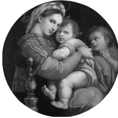
Rafael Sanzio. La Virgen de la Silla . 1514.