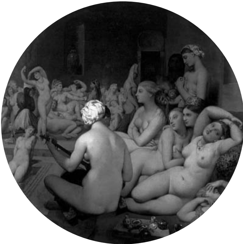
J. A. D. Ingres. Le Bain Turc . 1862.

péculo “para dilatar los labios, los orificios, las paredes” no puede penetrar el interior. Explorando esta relación entre luz, brillo y deseo, Irigaray ha dicho que “se hará todo el esfuerzo, sin embargo, para mantener la visión, al menos la visión, libre de destruirse por el fuego del deseo” 32 . Al cerrar esta dimensión luminosa, ilustrada del espejo, este ensamblaje parece hacer un demanda para ver, penetrar, y sin embargo, establece una restricción al deseo cuando resalta la polaridad maniquea masculina entre razón y deseo, masculino y femenino. En otras palabras, El baño turco o artífices del mármol encarna la dimensión conflictiva de la representación –orientalista, colonial– que pretende levantar el velo y sin embargo establece las distancias ópticas que impiden consumirse en la imagen incandescente. La versión de González de la pintura de Ingres desprecia sus de-