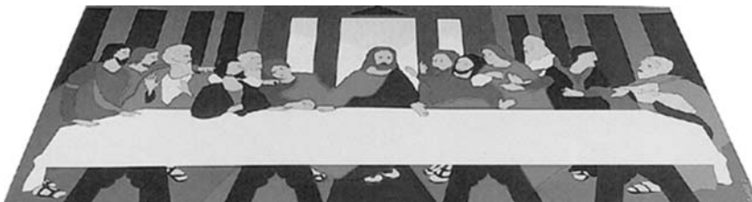
B. González. La Última Mesa . Esmalte sobre lámina metálica sobre mesa metálica, 105 x 205 x 75 cm, 1970.