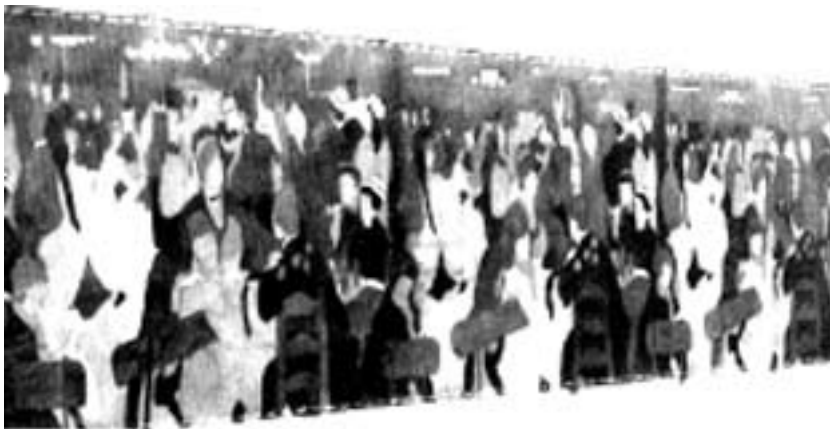
B. González. Diez Metros de Renoir . Óleo sobre papel, 120 x 1000 cm, 1977. Cortado y vendido por centímetros.

Frente a las producciones culturales pasadas, el artista tiene dos opciones: o revisa la cultura y toma una producción cualquiera para re-trabajarla según nuevos datos visuales [...] o utiliza un producto cultural pasado desubicándolo en su contexto y dando así paso al anacronismo del kitsch [...] En los dos ejemplos citados, el elemento cultural ha sido utilizado exactamente en la misma forma que es utilizada la realidad, o los sueños, o la geometría: como un punto de partida para hacer algo nuevo.