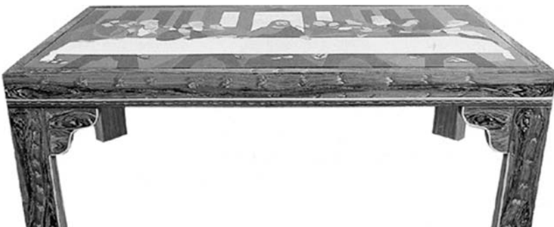
B. González. La Última Mesa . Esmalte sobre lámina metálica sobre mesa metálica, 105 x 205 x 75 cm, 1970.