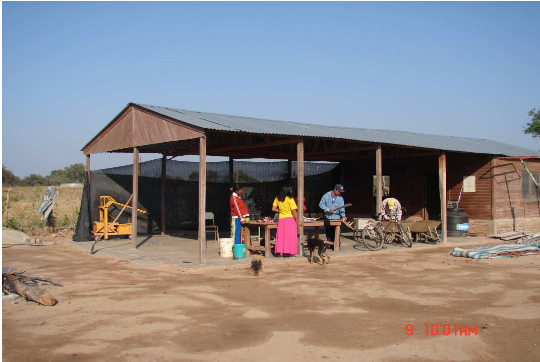
Figura 2. Proceso de producción en las instalaciones del PPAR en La Estrella. 9/08/2006.